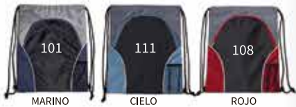
MARINO CIELO ROJO