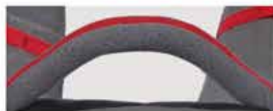
DETALLE DE LA BOLSA