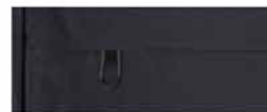
DETALLE DE LA BOLSA