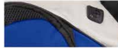
DETALLE DE LA BOLSA