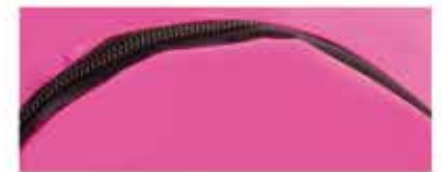
DETALLE DE LA BOLSA