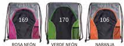
ROSA NEÓN VERDE NEÓN NARANJA