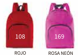
ROJO ROSA NEÓN