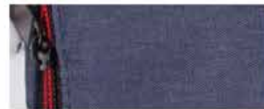
DETALLE DE LA BOLSA