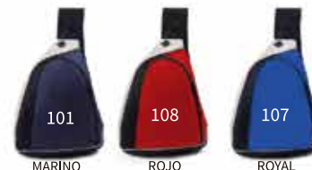
MARINO ROJO ROYAL