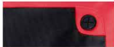
DETALLE DE LA BOLSA