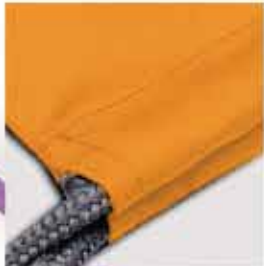
DETALLE DE LA BOLSA