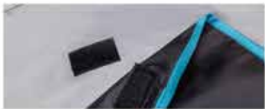
DETALLE DE LA BOLSA