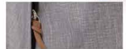
DETALLE DE LA BOLSA