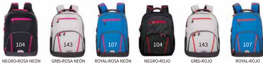
104 NEGRO-ROSA NEÓN