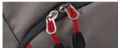
DETALLE DE LA BOLSA