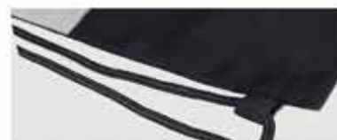
DETALLE DE LA BOLSA