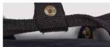
DETALLE DE LA BOLSA