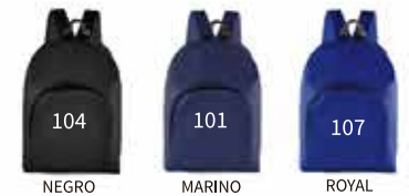
NEGRO MARINO ROYAL