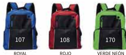
ROYAL ROJO VERDE NEÓN