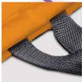
DETALLE DE LA BOLSA