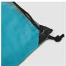
DETALLE DE LA BOLSA