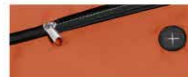
DETALLE DE LA BOLSA